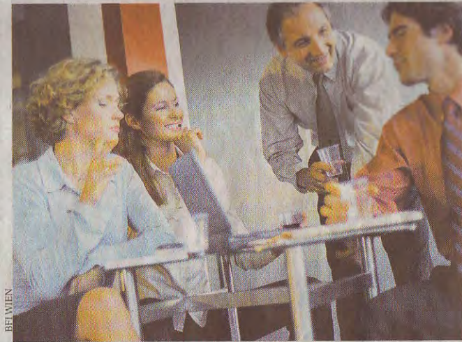
Führungskräfte aus dem unteren und mittleren Management unterschiedlichster Branchen sind speziell am Coaching interessiert

halten Führungskräfte Unterstützung im Umgang mit undurchsichtigen Entscheidungs- und Verantwortungsstrukturen sowie die Fähigkeit, die Perspektive zu wechseln: sich einerseits in ihre MitarbeiterInnen aber auch Vorgesetzte einzufühlen, andererseits deutlich Kritik üben zu können und Aufträge zu erteilen. Besonders dafür ist eine Ausbildung zum Coach geeignet, da diese das Handwerkszeug dafür vermittelt, die Selbstreflexions-Fähigkeit steigert und die Verantwortungsbereitschaft fördert. „Die Zusammensetzung der Ausbildungsgruppe beim bfi Wien bilden meistens Führungskräfte oder angehende Führungskräfte im unteren und mittleren Management aus unterschiedlichen Branchen“, erklärt Dr. Wendt, die auch als Psychologin, Coach, Organisationsentwicklerin und Lehrgangsleiterin am bfi Wien tätig ist. Weitere Infos erhalten Sie unter: www.bfi-wien.at