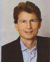
FORMAT- Ressortleiter Management & Karriere