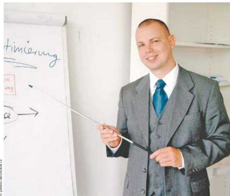
Ein Coach findet Lösungen und hilft, Ressourcen und Potenziale zu erkennen.

Als Coach kommen Menschen mit den unterschiedlichsten Anliegen wie Karrierefragen, Beziehungsprobleme, Führungsanliegen, etc. auf einen zu. Ein Coach hilft Probleme wahrzunehmen, Lösungen zu finden, eigene Ressourcen und Potenziale zu erkennen und zu nutzen. Mithilfe von Fragetechniken, Methoden und Instrumente werden die Klienten dabei unterstützt. Die Zielgruppe des Lehrgangs sind Berater von Organisationen, Trainer,