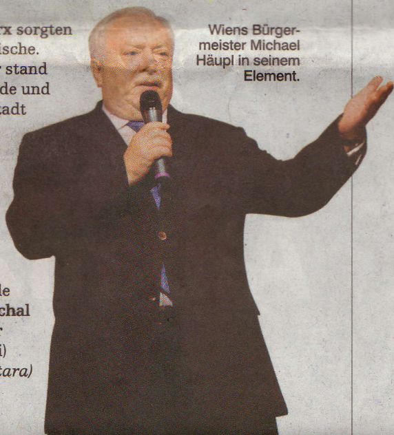
Wiens Bürger- meister Michael Häupl in seinem Element.